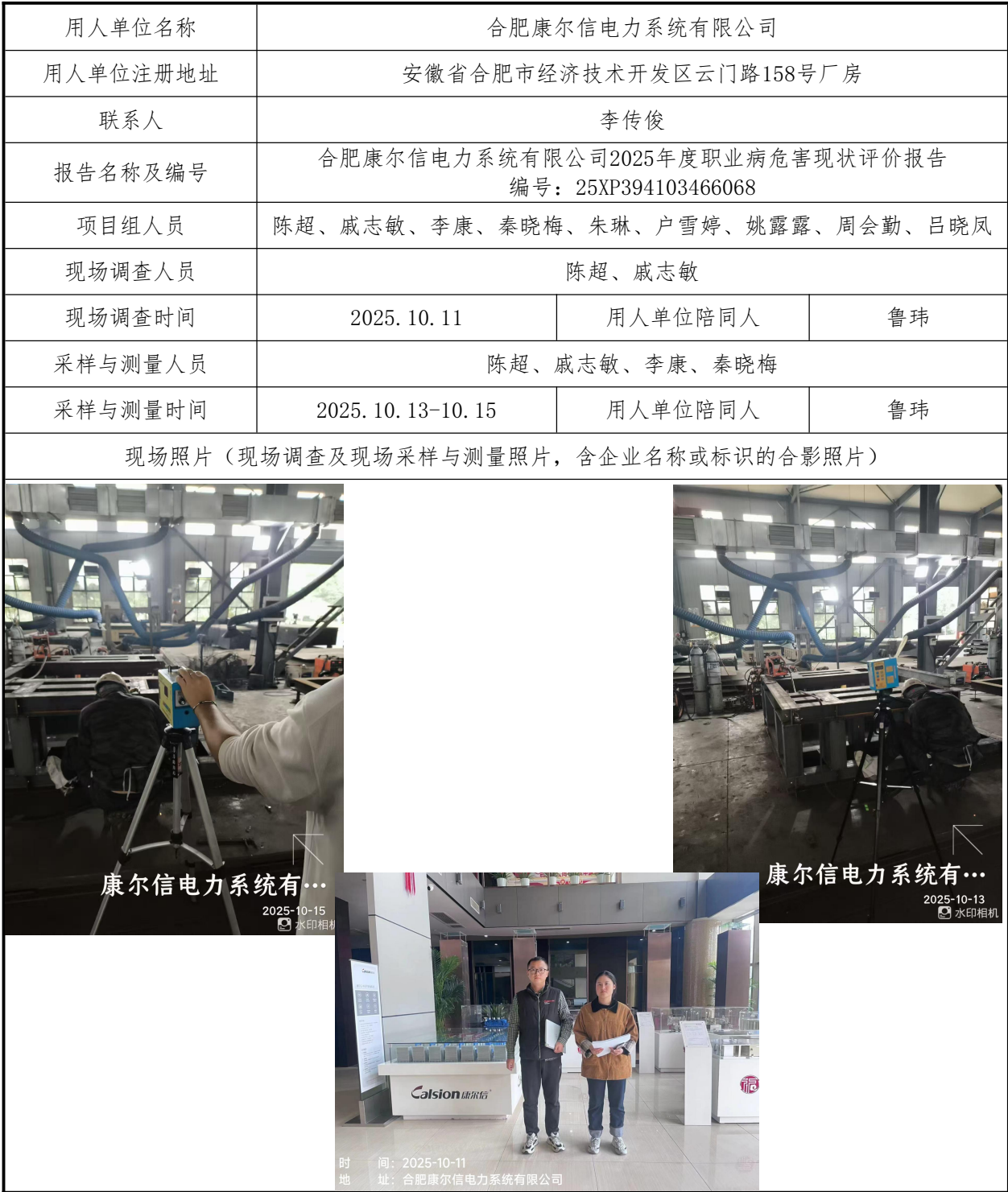
职业卫生技术报告公开信息一览表

注：职业病危害预评价、职业病危害防护设施设计只填写到项目组成员，项目组成员以下填写“/”。